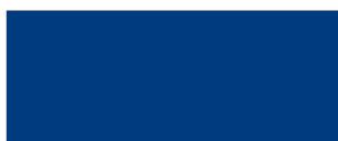
Bleu trafic 466

Les couleurs réelles peuvent présenter des nuances différentes. Contactez votre représentant pour recevoir des échantillons.